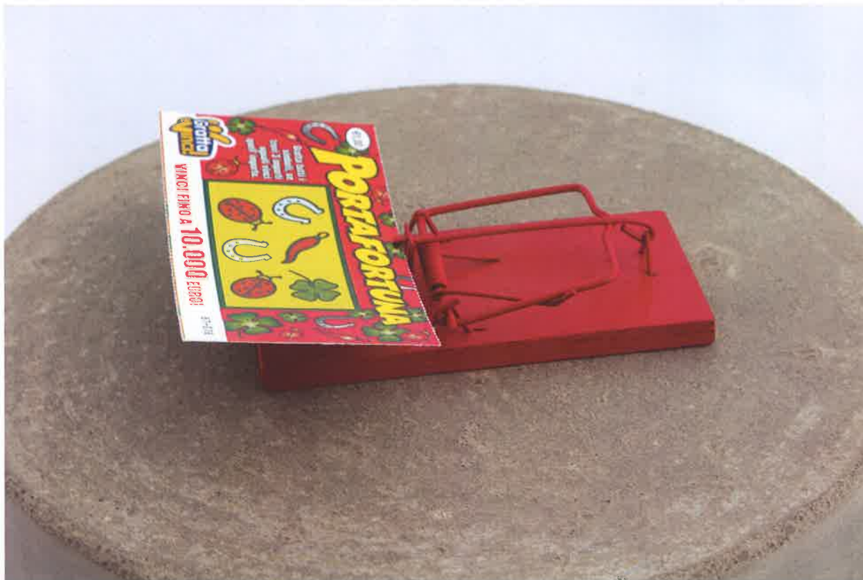
Mattia Sarti , Hazard 2 , 2016, cemento, legno, ferro e carta, 8x30x30 cm