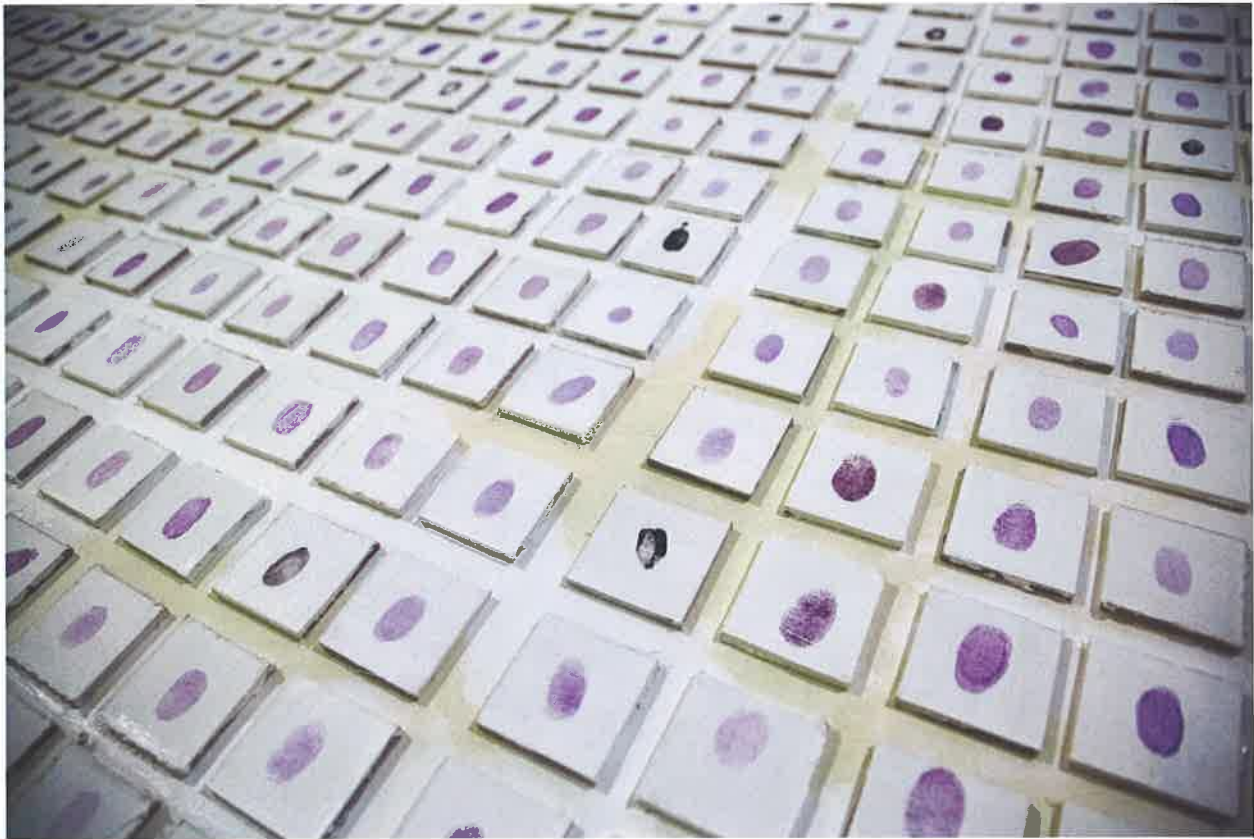
Benito Ligotti , Social Control, Tavola condivisa N°1 , 2013/2014, tecnica mista su tela, 196x196 cm