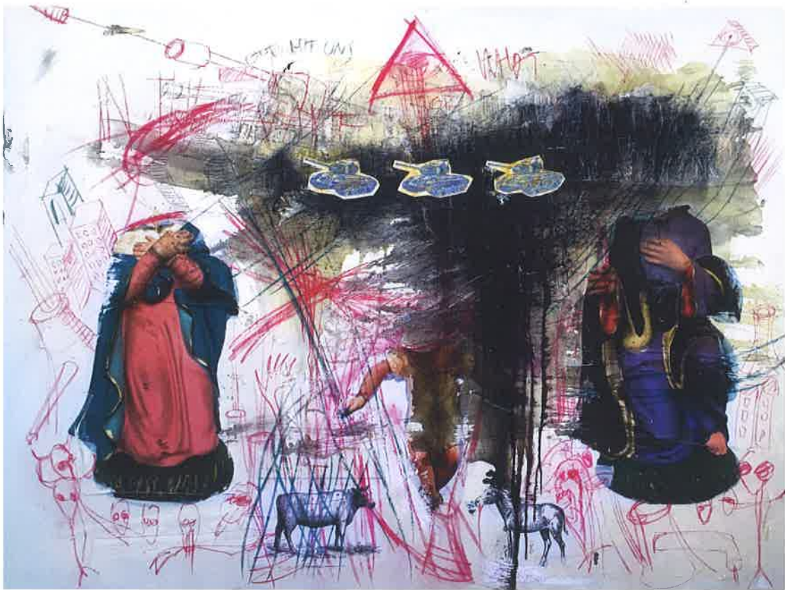
Massimo Divenuto , Modern Age 6 , 2016, collage, stucco, smalti, acrilici, pastelli, gessetti su tela, 150x200 cm