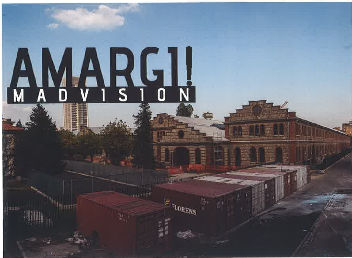
MadVision , Amargi , 2016, 2016, stampa digitale, collage, plexiglass, 64x84 cm