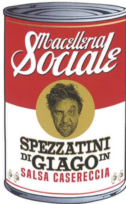
Macelleria Sociale , Macelleria Sociale , 2016, stampa digitale, 180x130 cm