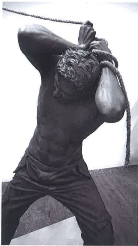
Simone Benedetto , Untitled , 2016, scultura, materiali vari, 300x200x400 cm