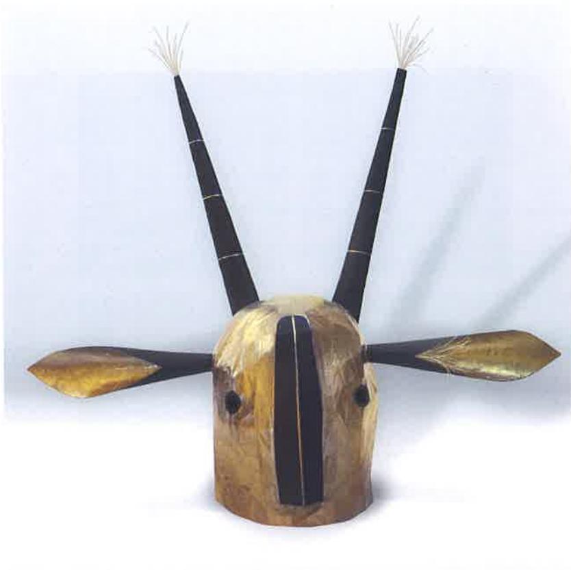
Isoi , Alter-Ego , gesso, 2016, filo di ferro, cartone, cartapesta, acrilico e foglia oro, 90x76x30 cm