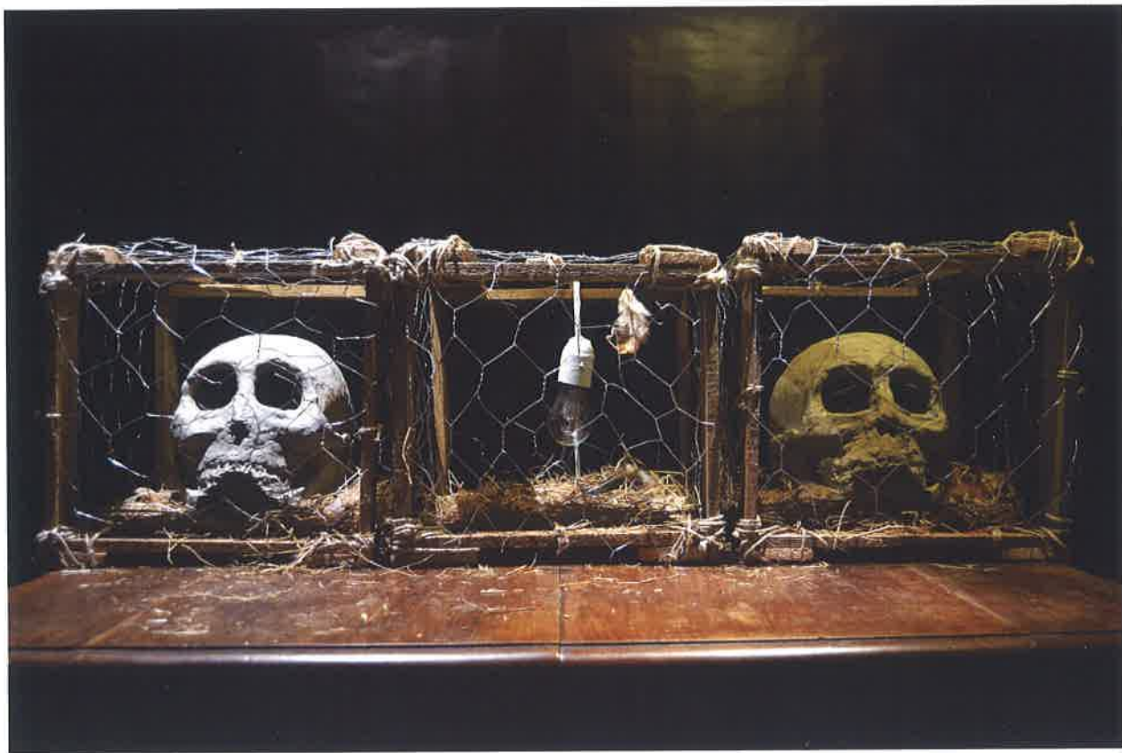
Nazareno De Santis , Logòs , 2016, installazione, argilla, legno, materiali vari, 30x35x100 cm