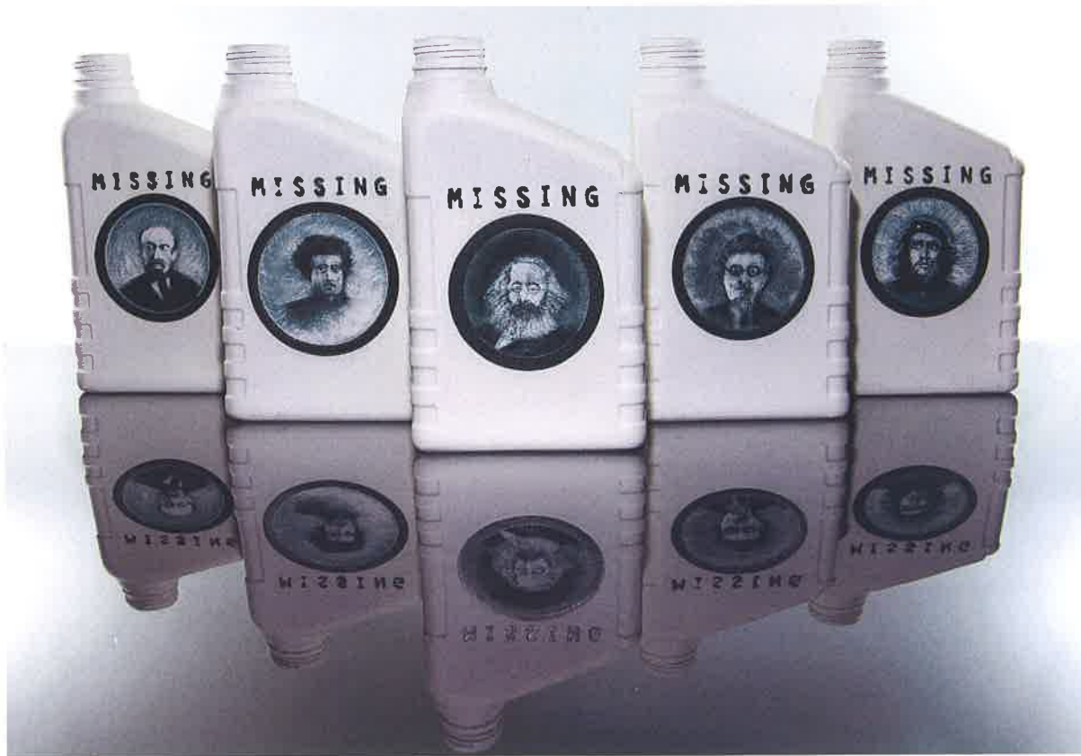
Cinzia Carantoni , Capital Oil , 2014, porcellana di Limoges a colaggio, cristallina e ossidi dipinti a pennello, 5 elementi, 19x11x5 cm