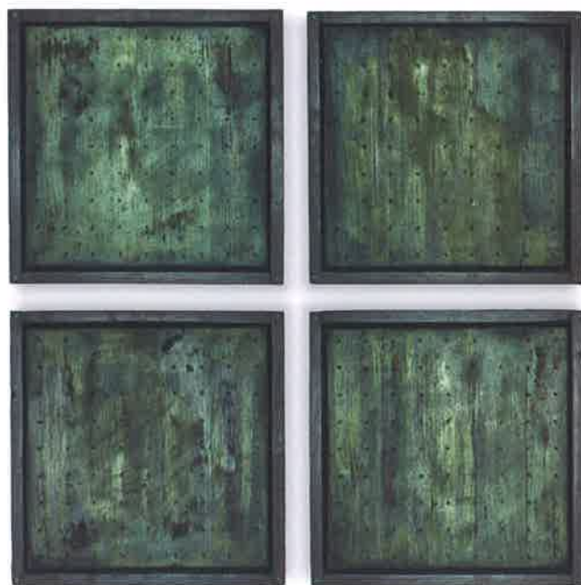
Francesco Speciale , Imperium , 2016, clouage e pigmenti su legno, 45x45x9,9 cm