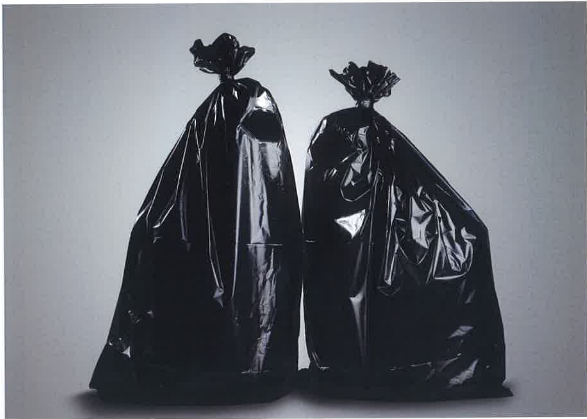
Sebastian Contreras , Senza Titolo 30 , 2010, installazione, materiali vari, 102x99x72 cm