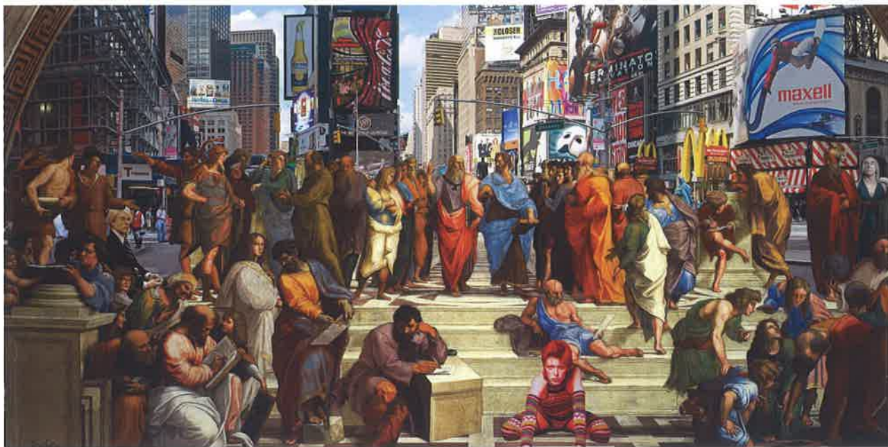
Bisha , Athen NY Pop Trinity , 2016, grafica digitale, tela, 90x160x4 cm