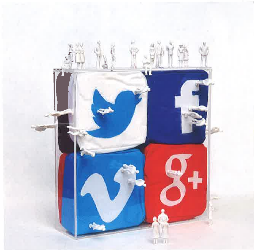
Lucia Cannone , Follow me , 2014, installazione, materiali vari, 25x25x10 cm